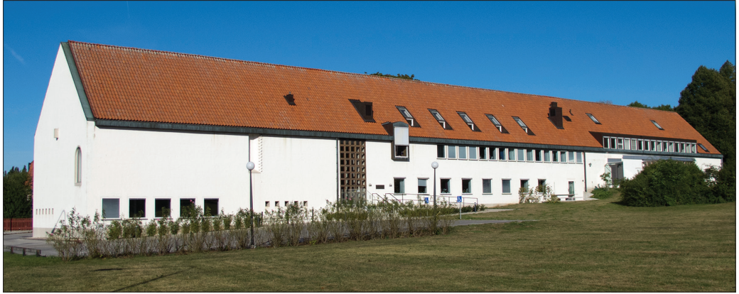
Tingshusets fasad mot söder.